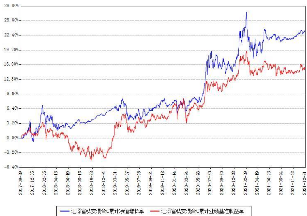
汇添富弘安混合C累计净值增长率与同期业绩基准收益率对比图